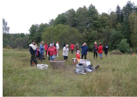
Kohtaamisia Marttilan Kumpulanrannassa 1.9.2013

Kohtaamisia Paimionjoella yleisötilaisuuksien tarkoituksena oli kohdata tavallisia paikallisia ihmisiä heille tärkeässä jokivarsikohteessa ja esitellä heille hankkeen toteuttaja sekä hankkeen tavoitteet ja motiivit. Tavoitteena oli antaa paikallisille ihmisille ääni ja mahdollisuus vaikuttaa hankkeen sisältöön ja kehityssuuntaan. Tavoitteena oli lähestyä ihmisiä tavalla, joka mahdollistaa yksityisen ihmisen kuulemisen ja huomioon ottamisen. Hanke voisi kasvaa edes jollain tavalla merkittäväksi vain kohdatessaan paikallisia ihmisiä ja kuulemalla heidän toiveitaan sekä tuottamalla heille merkityksellisiä asioita käytäntöön.