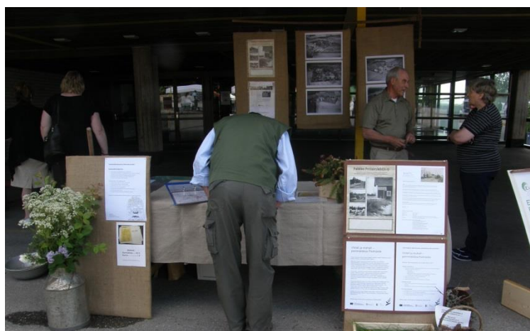
Paimion Perinneyhdistys esitteli hanketta ja keräsi tietoa Viva Vista -tapahtumassa v. 2013.

Sisäinen tiedottaminen hoidettiin sähköpostitse ja puhelimella, samoin yhteydenpito rahoittajatahoon ja yhteistyökumppaneihin.