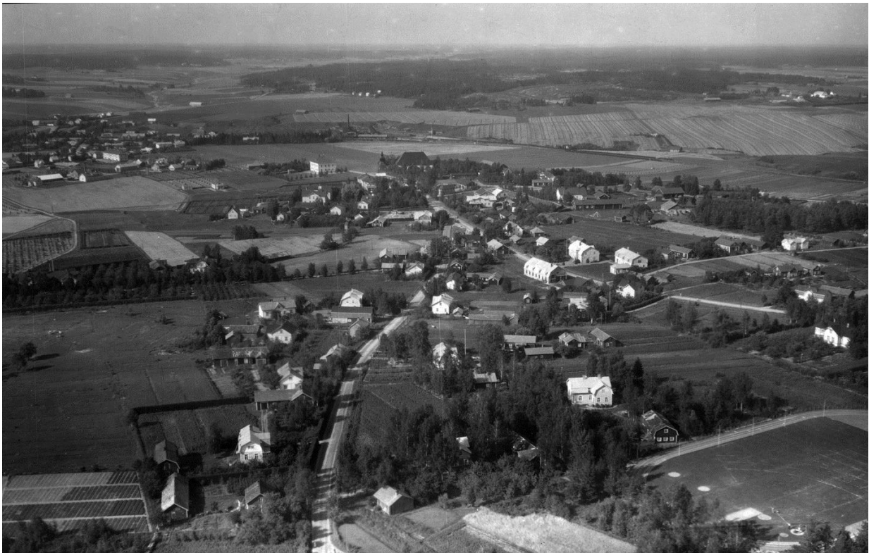
Näkymä Vistan yli 1930-luvun lopulla. Kuva on hankkeen aikana järjestetyn keruun satoa.

Paimion Perinneyhdistys ry on vuonna 2008 rekisteröity kotiseutuaktiivinen yhdistys, jonka toiminnan tarkoituksena on edistää ja tukea Paimion seudun perinteen keräämiseen ja julkaisemiseen liittyvää toimintaa ja harrastusta sekä kerätä, taltioida ja julkaista henkiseen ja aineelliseen kulttuuriin liittyvää materiaalia.