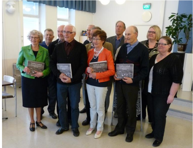
Paimion Perinneyhdistyksen väkeä kirjan julkaisutilaisuudessa toukokuussa 2014.

Kirjan julkaisutilaisuus järjestettiin kutsuvierastilaisuutena Paimion Wanhalla seurakuntalolla 27.5.2014. Tilaisuuteen oli kutsuttu Perinneyhdistyksen hallituksen ja hankkeen tiedonkeruusta vastanneiden henkilöiden lisäksi sidosryhmien edustajia. Kutsut lähetettiin myös Paimion kirjastolle, Paimion kouluille sekä kolmelle vanhus-tenhuollon yksikölle, joiden edustajille tilaisuudessa lahjoitettiin kirjat käytettäväksi kotiseutuopetuksessa ja perinnetyössä.