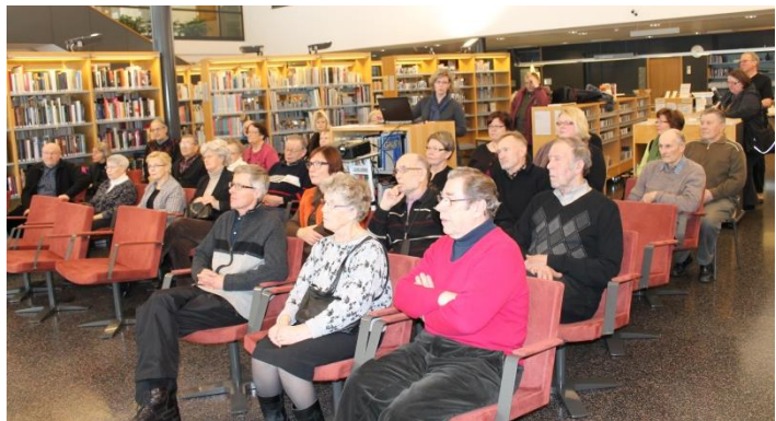
Internetsivujen julkaisutilaisuus Paimion kirjastossa helmikuussa 2012.

Internetsivujen julkaisutilaisuus järjestettiin helmikuussa 2012 Paimion kirjastossa. Tilaisuudessa hankekoordinaattori esitteli sivuston, jonka jälkeen seurasi eri aiheista syntyneitä keskustelua.